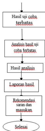
Gambar 1. Tahapan Pengembangan Tes Objektif Pilihan Ganda.