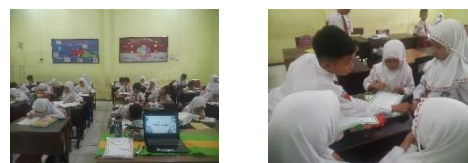
Gambar 2. Dokumentasi Pretset dan Treatment 1

Pengamatan dan peninjauan keterampilan menulis siswa sebelum diberikannya treatment (perlakuan) menggunakan model pembelajaran kooperatif tipe roundtable dilakukan melalui kegiatan observasi awal dan pemberian pretest . Berdasarkan hasil observasi awal didapati bahwa sebagian besar siswa kelas IV SDN Lesanpuro 1 masih kesulitan dalam menulis teks prosedur dengan tepat. Namun, setelah pemberian treatment dengan menggunakan model roundtable sebagai model pembelajaran yang tepat dalam keterampilan menulis teks prosedur pada siswa menunjukkan adanya peningkatan. Hal tersebut diakibati oleh beberapa unsur diantaranya adalah pemilihan model pembelajaran yang benar yang akan digunakan selama proses pembelajaran. Manfaat dari model pembelajaran adalah sebagai dasar dan pedoman dalam merancang dan melaksanakan pembelajaran (Octavia, 2020).