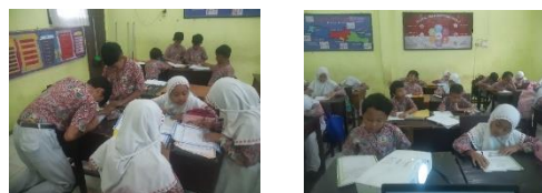
Gambar 4. Dokumentasi Treatment 3 dan Posttest

Fokus materi pada pertemuan terakhir adalah mereview seluruh materi teks prosedur. Adapun materi pada treatment 1 adalah tahapan atau langkah-langkah dalam menulis struktur teks prosedur. Menurut Adlani (2023) memaparkan tahapan menulis teks prosedur yakni: 1) Menentukan topik, yang akan dibahas dalam teks prosedur. 2) Mencari Informasi, yang harus berkaitan dengan topik yang dipilih. 3) Membuat Kerangka, yang berarti menuliskan garis besar langkah-langkah yang akan dilakukan pada topik yang dipilih. 4) Membuat Paragraf, yang berarti menulis secara detail langkah-langkah yang akan dilakukan pada topik yang dipilih. 5) Menyusun Teks Prosedur.